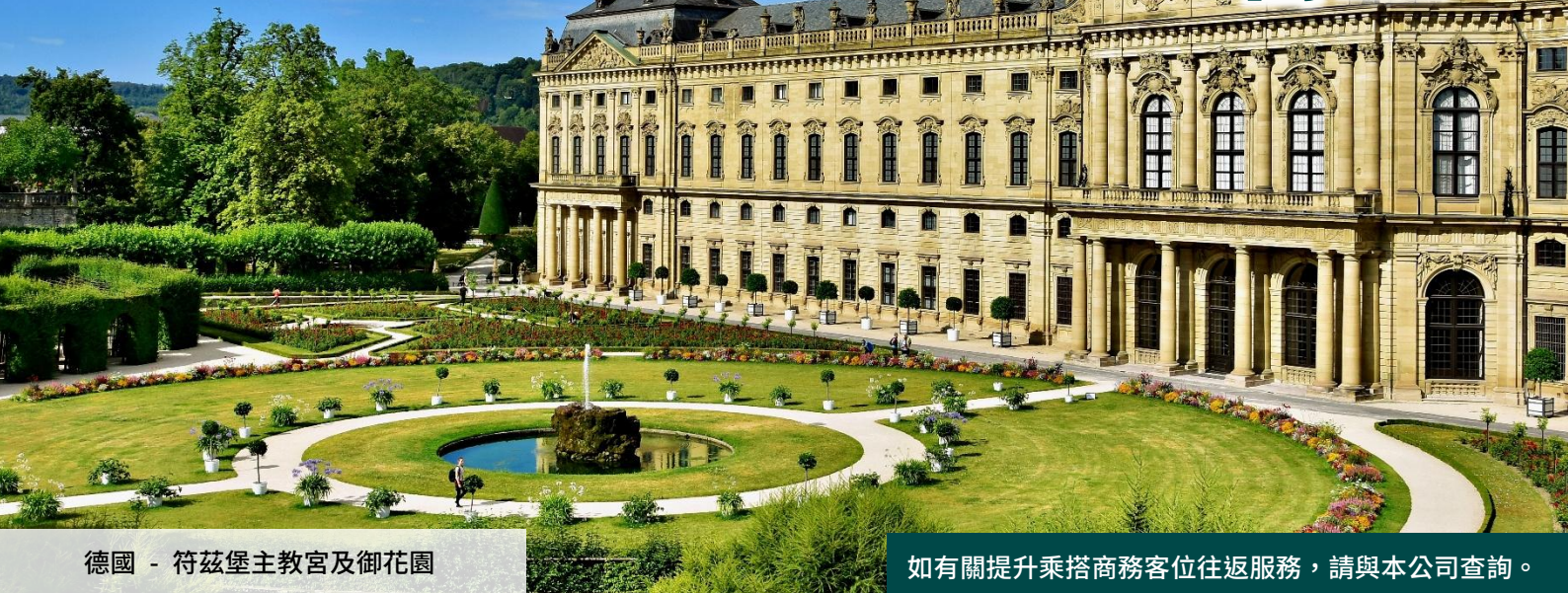
德國 - 符茲堡主教宮及御花園