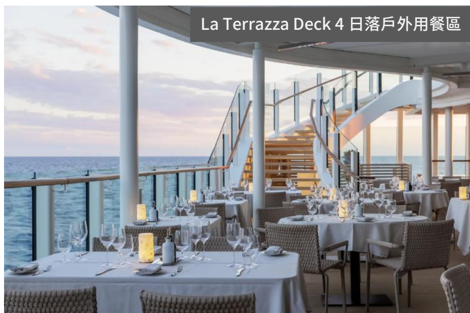
La Terrazza Deck 4 日落戶外用餐區