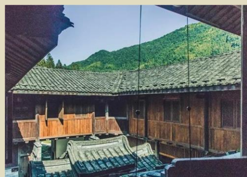
吾鄉山景房 / 睡鄉山景房（特色房型主要以提供大床房為主）