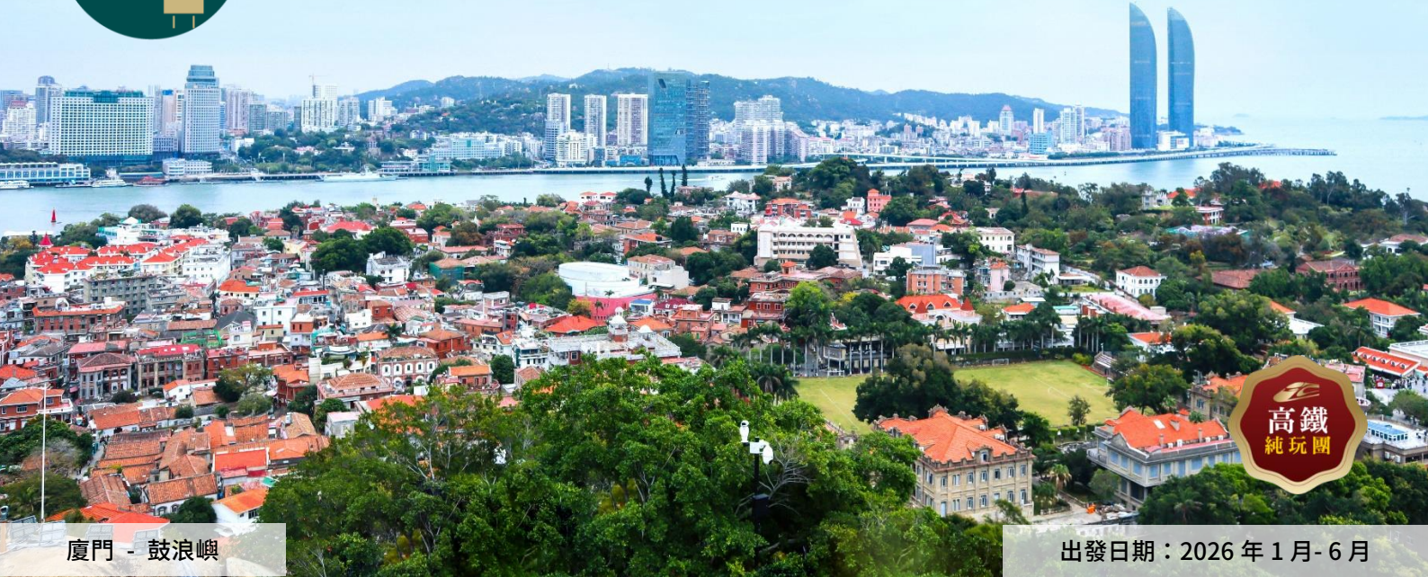
廈門 - 鼓浪嶼