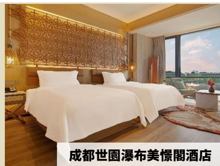
成都世園瀑布美憬閣酒店