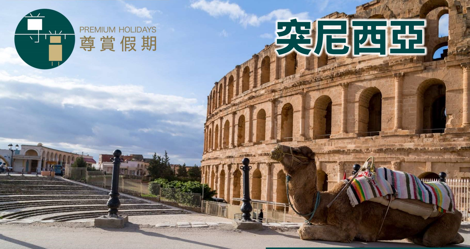
突尼西亞 - 伊利捷競技場