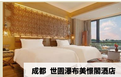
成都 世園瀑布美憬閣酒店