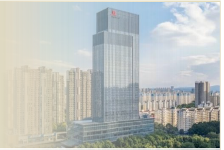
《連住 3 晚》洛陽 - 萬豪酒店