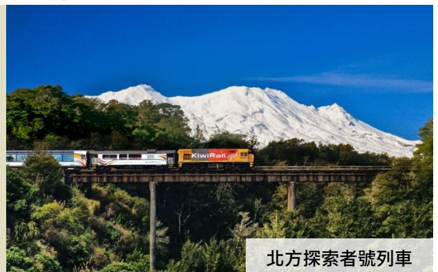
北方探索者號列車

傳承尊賞假期瑞士鐵道之旅到太平洋的奇異國度 鐵道之旅是一種獨特而令人難忘的旅行體驗。不僅提供舒適便捷的交通方式，還可以讓您沉浸在壯麗的風景中。搭乘火車您可以欣賞到無法從其他交通工具中得到的美景，感受大自然的魔力。可以結識來自世界各地的鐵道旅遊同好者，分享旅行故事和文化。最大得是從鐵道遊開始建立對環境友好，減少碳排放。選擇鐵道之旅，您將享受獨特的旅行體驗，探索新的地方，創造珍貴的回憶。無論你是否曾經到過新西蘭旅遊，這一趟 12 天的鐵道之旅，你都值得嘗試！