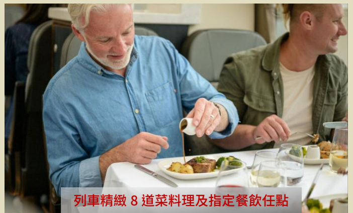
列車精緻 8 道菜料理及指定餐飲任點