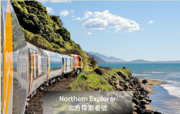
Northern Explorer 北方探索者號