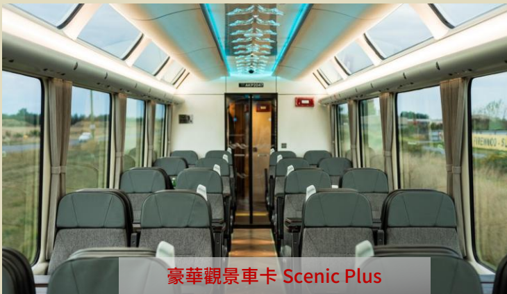
豪華觀景車卡 Scenic Plus