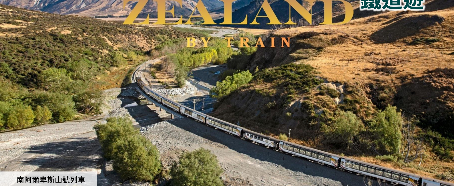
南阿爾卑斯山號列車