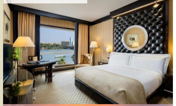
Fairmont Nile City