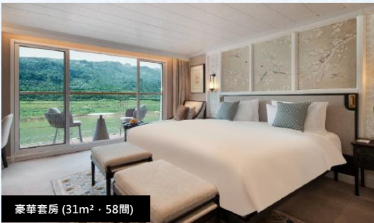
豪華套房 (31m 2 · 58間)