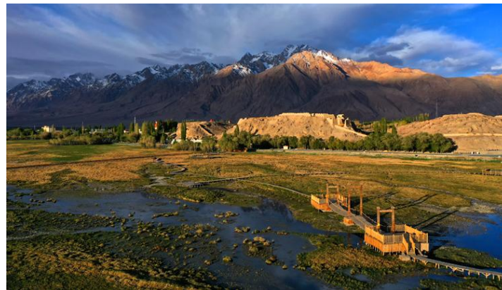
✦ 5 星標準 喀什逸扉酒店 或 希爾頓歡朋酒店 或同級

🏞️ 金草灘濕地: 位於在石頭城下。因有塔什庫爾幹河流經此處, 水草豐美, 牛羊遍地, 和遠處的雪山白雲藍天交融。