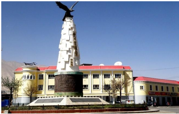
✦ 4 星標準 塔什庫爾幹雪上皇冠酒店 或 全景星空酒店 或同級