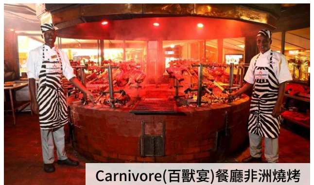
Carnivore(百獸宴)餐廳非洲燒烤