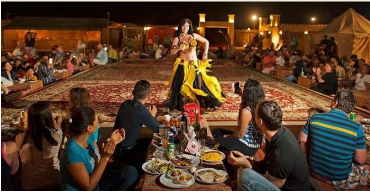
Al Khayma Heritage 中東民族特色餐廳