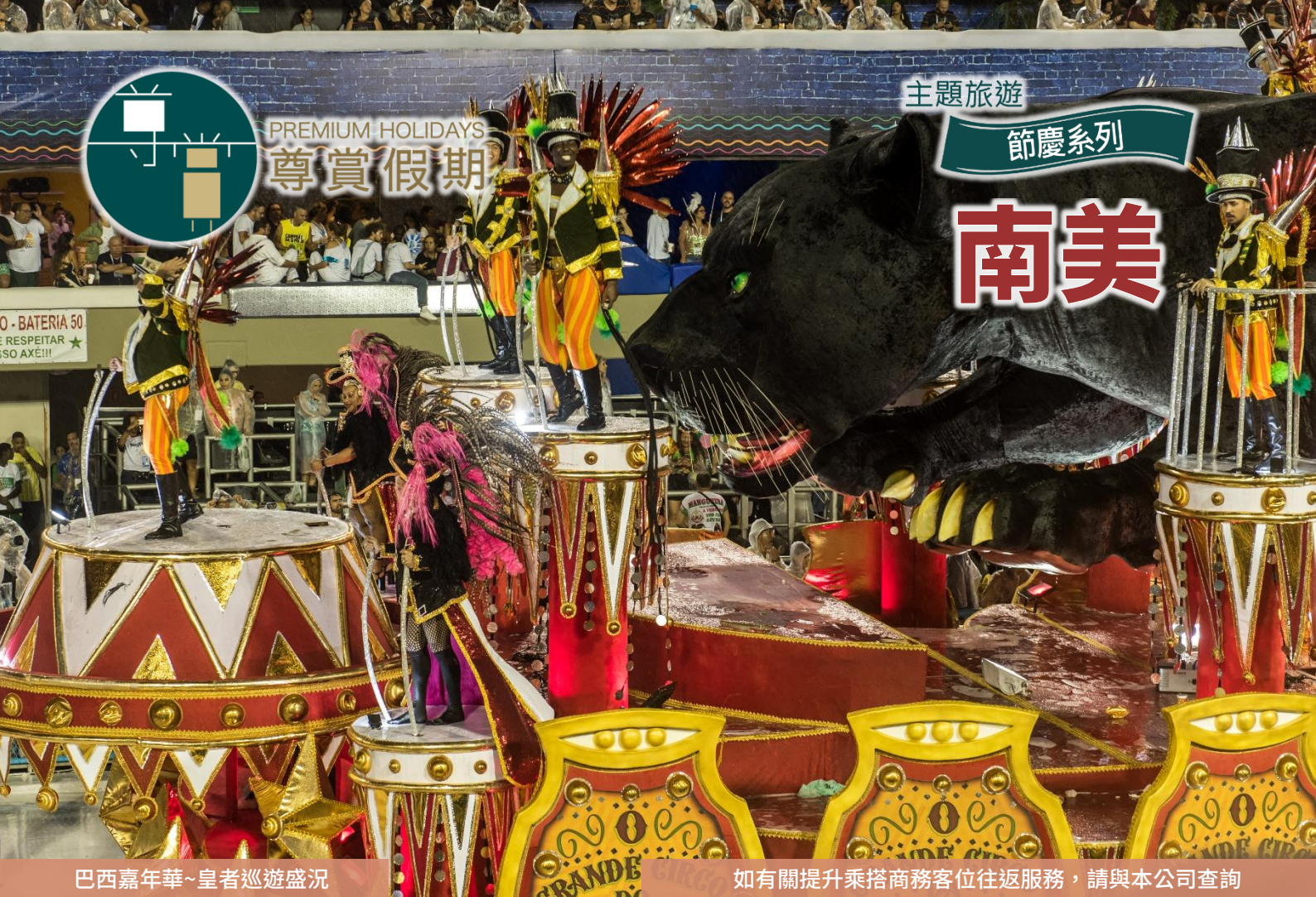
巴西嘉年華~皇者巡遊盛況