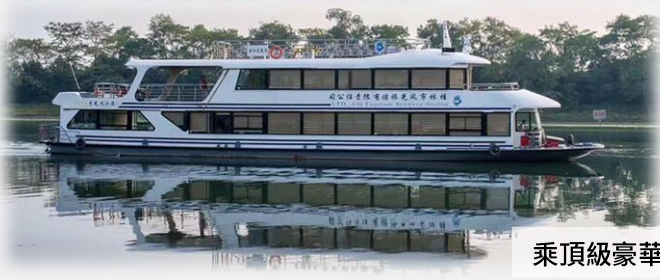
乘頂級豪華遊船漫遊灕江