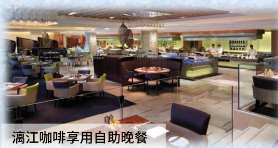
灕江咖啡享用自助晚餐