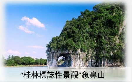
“桂林標誌性景觀”象鼻山