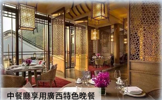
中餐廳享用廣西特色晚餐

【心靜軒別墅】Imperial Retreat Villa (約 1160 尺) 套房式特大床設計，獨立泡池，私家花園