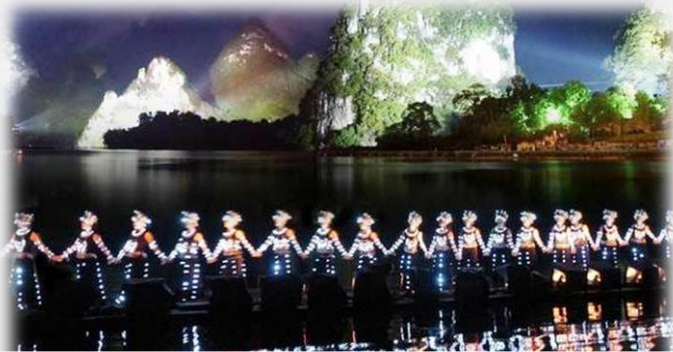
“全中國首部山水實景歌舞表演”《印象劉三姐》