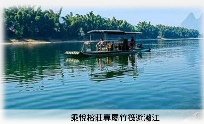
乘悅榕莊專屬竹筏遊灘江