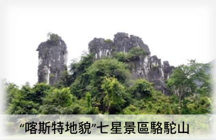
“喀斯特地貌”七星景區駱駝山