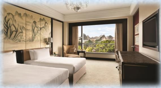
【豪華江景客房】 (約 450 尺) Deluxe River View Room

酒店坐落於風景如畫的灕江之濱，可欣賞到灕江兩岸旖旎風光、綠意盎然的園林景致及桂林典型喀斯特地貌。這裡不僅是一家酒店，也是一座迷你版的遊樂園、動物園和植物園。