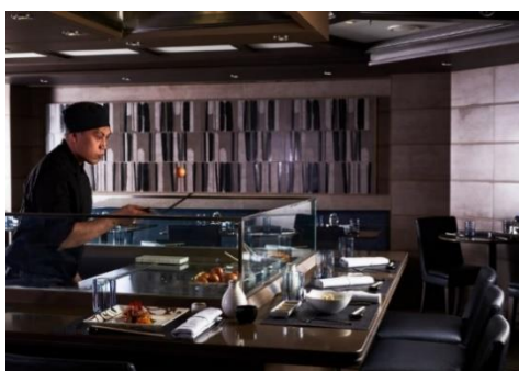
Kaiseki 懷石料理(額外收費)