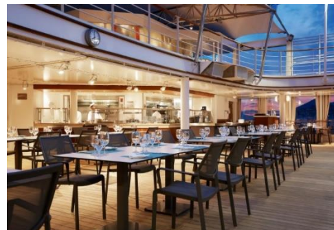
The Grill 燒烤餐廳