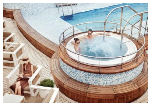
Pool Deck & Jacuzzi Area 泳池甲板