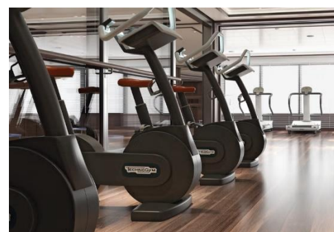
Fitness Centre 健身室