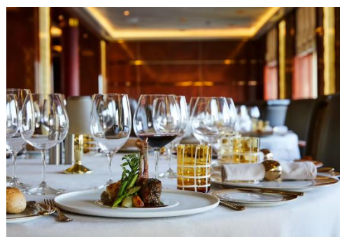
La Dame 法式餐廳(額外收費)