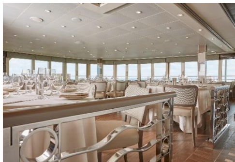
La Terrazza 意式餐廳

8 間餐廳，咖啡廳，全景休息室，賭場、美容中心，水療中心，健身中心，游泳池，日光浴台，圖書館，精品店，醫療中心。於船上享受一系列豪華設施，從容愜意地沐浴於旅程中。