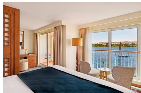
雙露台套房 Luxury Suite Cat. LS - 430 sq. ft