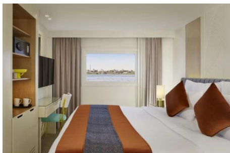
河景房 Fixed Windows Cat. E - 215 sq. ft.

AmaLilia 是尼羅河上名符其實的珍寶。這艘精心打造的遊輪以埃及風情為靈感打造高端內飾，設有41間客房 (包含13間套房)，以阿瑪水路獨有的奢華設施與專屬體驗，引領賓客優雅暢遊埃及。您可在主餐廳品嚐融入中東香料的西式美饌與道地佳餚，還可在行政主廚晚宴專屬之夜，體驗多道式品嚐菜單的舌尖盛宴。船上更提供按摩、修甲同腳部護理等服務，煥然一新。更有人文學者專家隨航講解，在這段迷人的河輪之旅中帶您探索古國智慧。