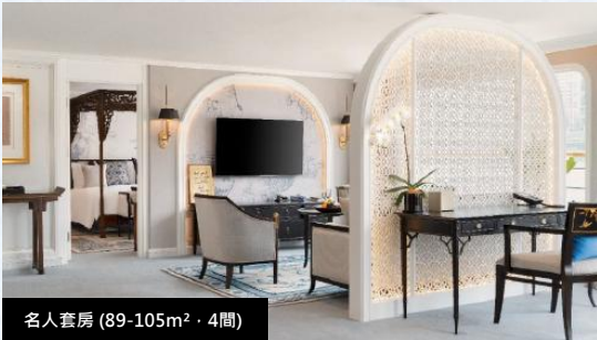
名人套房 (89-105m 2 · 4間)

正餐期間指定品牌進口紅白酒 大使套房陸地觀光獨立成團 大使套房專屬管家服務 航行日每日水果盤 參觀船長室活動 登船城市單程接機/站服務 (1次, 可指定日期, 需預約)