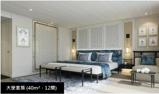
大使套房 (40m 2 · 12間)

客房內附膠囊咖啡機 遊輪全天茶水小吃 客房內甄選飲用水 陸地觀光不限量瓶裝水 景區內 接駁車 或 小交通 遊輪專屬解說服務 陸地觀光專屬導覽服務 陸域觀光 VOX 講解接收器 特邀專家主題講座 最高50萬保額國內旅遊意外險