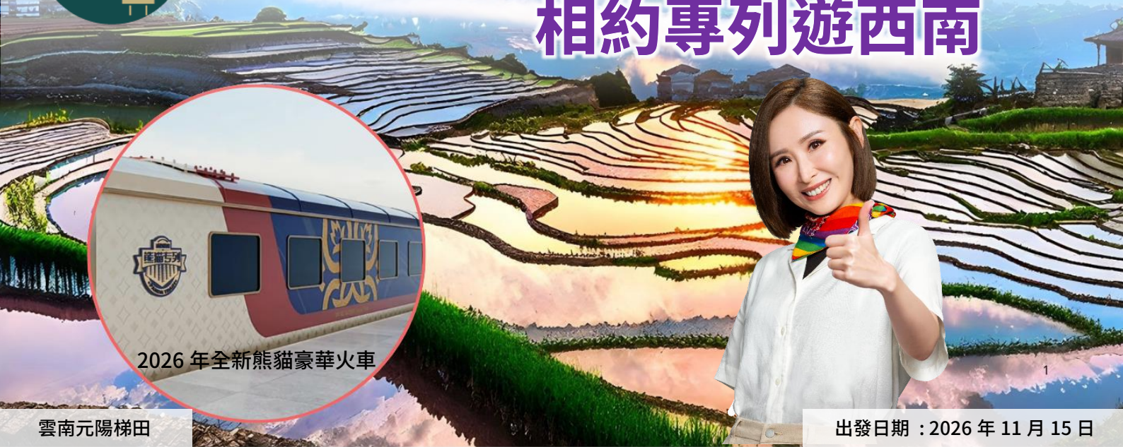
2026 全新熊貓豪華火車