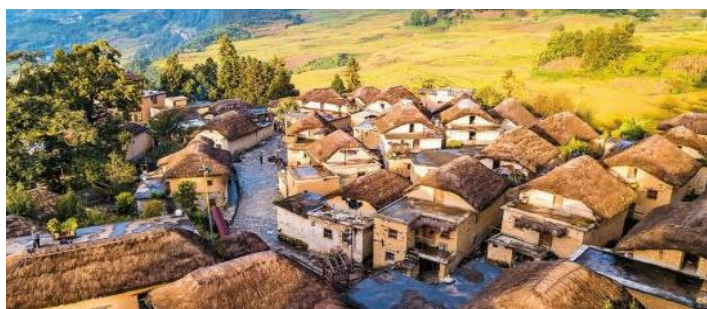
壩達梯田* ：是哈尼梯田世界文化遺產核心區，以面積巨大約 950 公頃、觀賞壯麗的「日落夕陽」景觀而聞名。