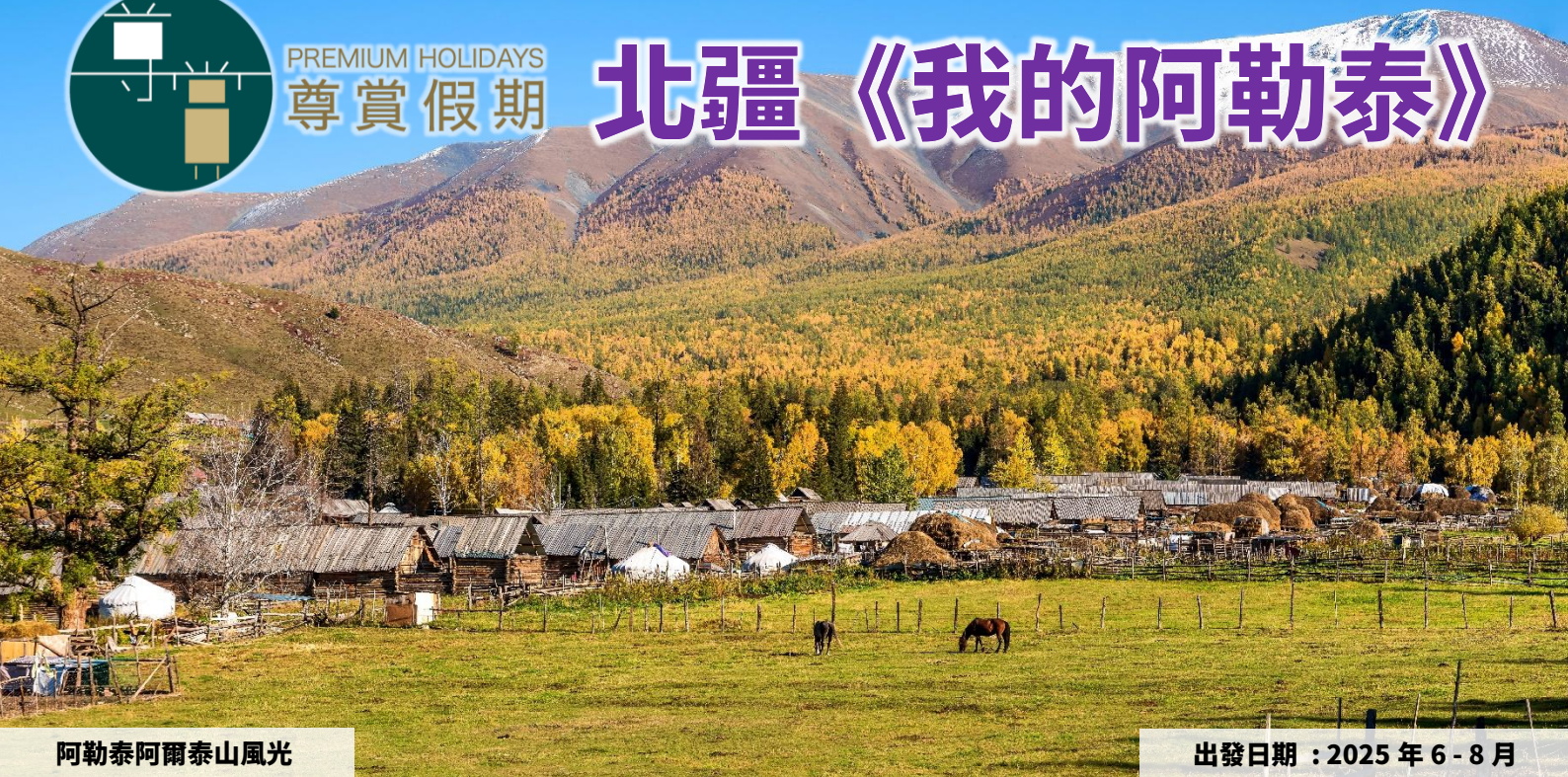
阿勒泰阿爾泰山風光