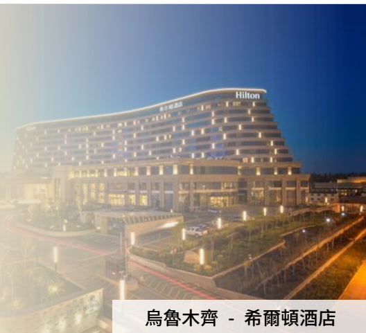
烏魯木齊 - 希爾頓酒店

“禾木村 2023 年開業特色精品酒店” 禾木舒泊瑞斯酒店 (Hemu Surprise Hotel)