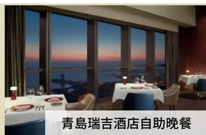
青島瑞吉酒店自助晚餐