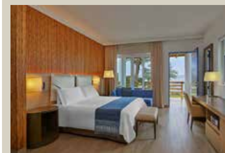
帕拉卡斯 2 晚入住 5 星級 Hotel Paracas, a Luxury Collection Resort 或同級