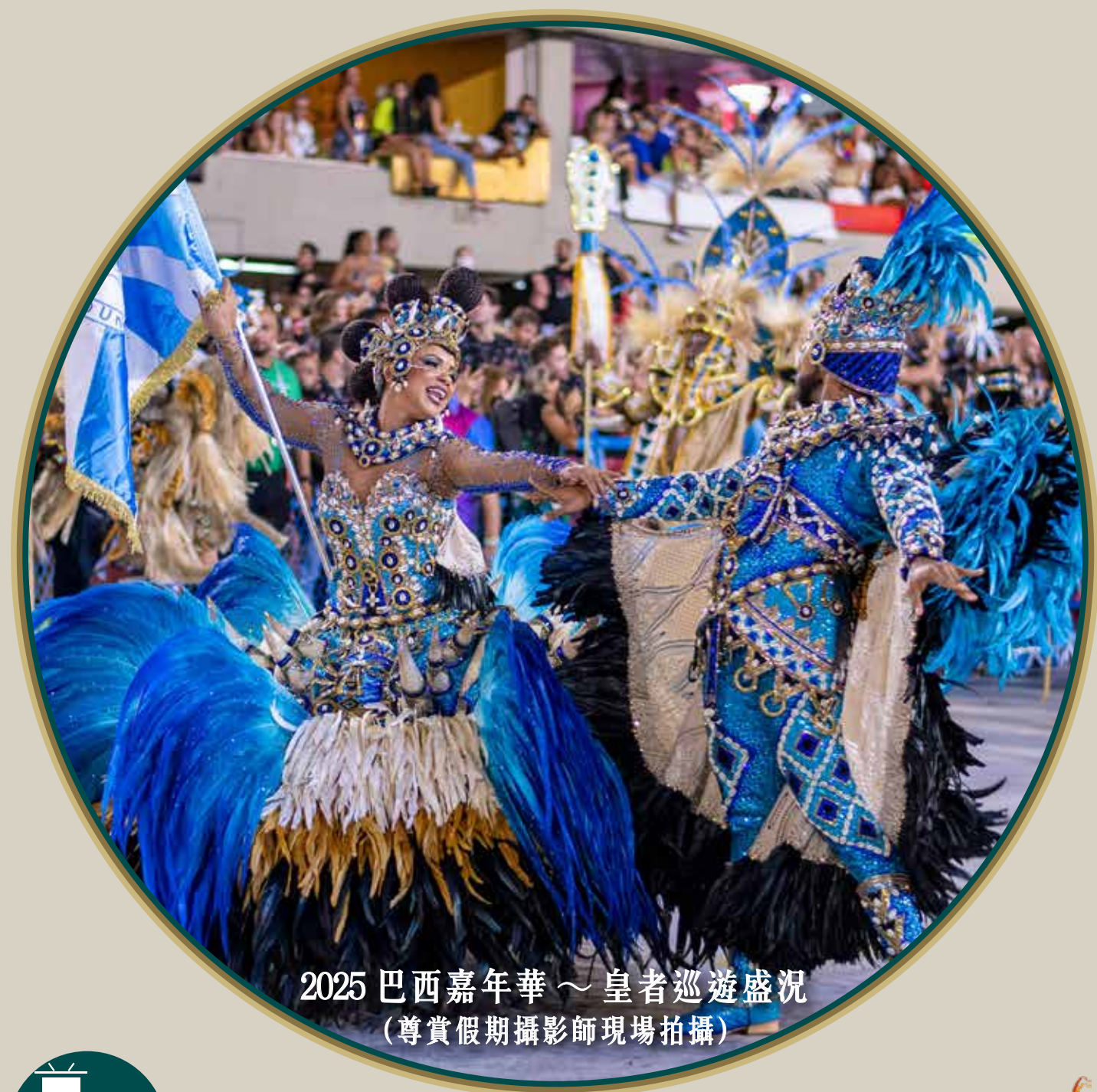
2025 巴西嘉年華～皇者巡遊盛況 (尊賞假期攝影師現場拍攝)