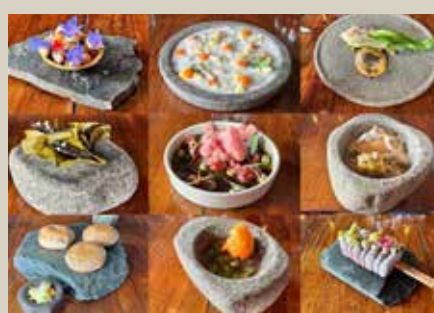
南美洲 50 佳餐廳 Gustu