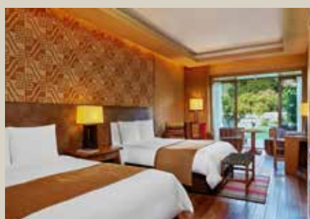
烏魯班巴河谷入住 5 星級Tambo Del Inka, a Luxury Collection Resort & Spa烏魯班巴唯一 擁有火車站前往馬丘比丘