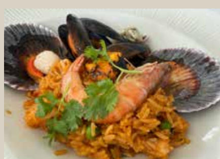
海中玫瑰La Rosa Nautica 海景餐廳