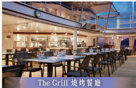
The Grill 燒烤餐廳