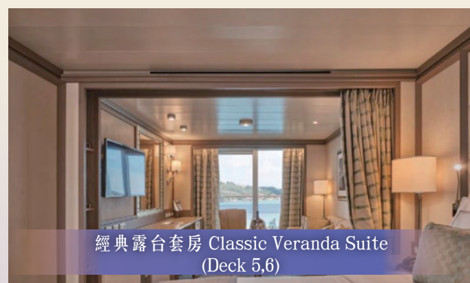
經典露台套房 Classic Veranda Suite (Deck 5,6)