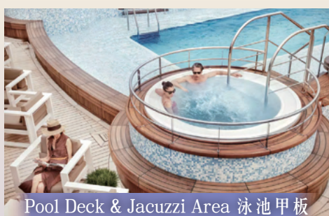
Pool Deck & Jacuzzi Area 泳池甲板