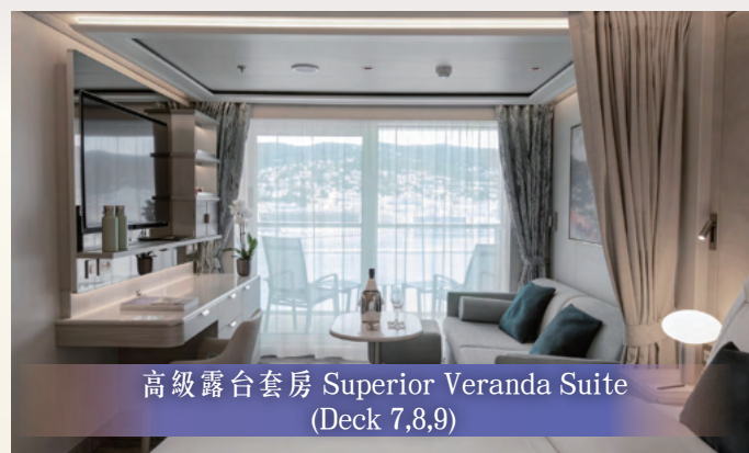
高級露台套房 Superior Veranda Suite (Deck 7,8,9)

高級露台套房面積約36平方米(388平方呎)，露台(約6平方米，約65平方呎)，私人露台令您享有壯麗的日落美景，配備所有舒適和豪華設施，寬敞的居住空間及銀海遊輪對細節的關注，是您在海上假期時的溫馨之家。