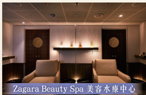
Zagara Beauty Spa 美容水療中心