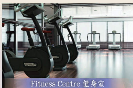
Fitness Centre 健身室