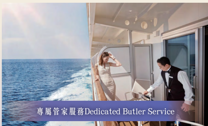
專屬管家服務 Dedicated Butler Service

高級露台套房面積約36平方米(388平方呎)，露台(約6平方米，約65平方呎)，私人露台令您享有壯麗的日落美景，配備所有舒適和豪華設施，寬敞的居住空間及銀海遊輪對細節的關注，是您在海上假期時的溫馨之家。