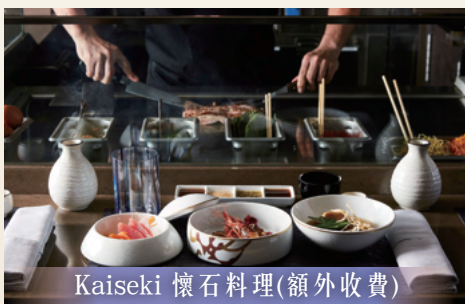
Kaiseki 懷石料理(額外收費)