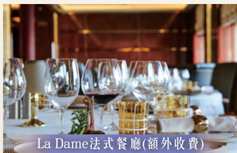
La Dame 法式餐廳(額外收費)