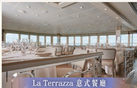
La Terrazza 意式餐廳

8間餐廳，咖啡廳，全景休息室，賭場、美容中心，水療中心，健身中心，游泳池，日光浴台，圖書館，精品店，醫療中心。於船上享受一系列豪華設施，從容愜意地沐浴於旅程中。