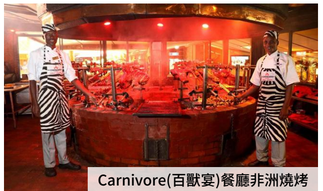
Carnivore(百獸宴)餐廳非洲燒烤