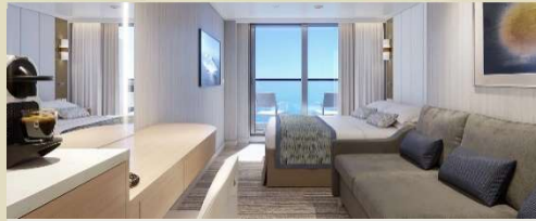
露台房 Deluxe Balcony 房間面積約 235 平方尺