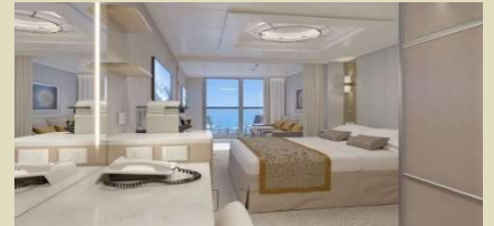
迷你套房 Mini Suite 房間面積約 303 平方尺