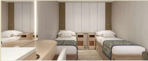
內艙房 Interior 房間面積約 136 至 145 平方尺

太陽公主號高 21 層，設 2,157 間客艙，包括 50 間套房艙和 100 間相連房，露台空間更闊落。除了一般房型外，太陽公主號更推出全新級別的「精選系列」套房艙系列，除了可以享受獨有的尊尚禮遇外，還可於專屬的「精選餐廳」、「精選酒廊」用餐等，詳情可向本公司查詢。