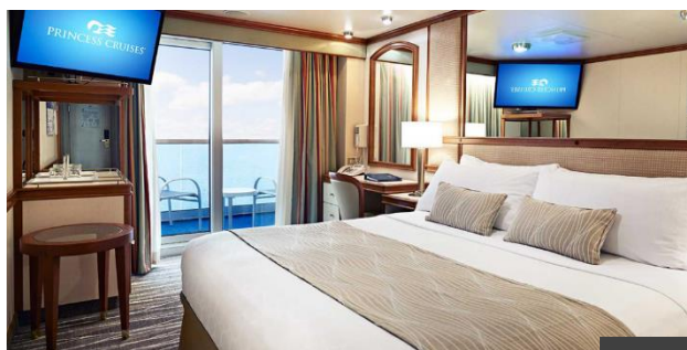
露台房面積約 215 呎，露台面積約 47 呎