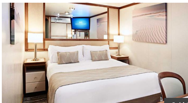
內艙房面積約 162 呎