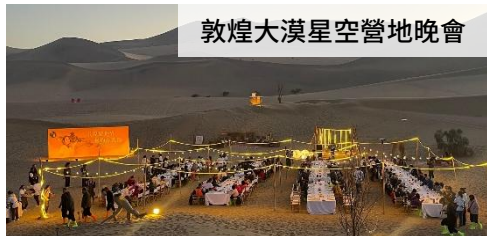
敦煌大漠星空營地晚會

敦煌：大漠星空營地晚會風味、酒店特色風味 茫崖：手抓羊肉風味 若羌：紅棗大盤雞風味 庫爾勒：酒店特色風味 庫車：牛肉火鍋風味 阿克蘇：酒店特色風味 莎車：民族風味西餐 塔什庫爾幹：犛肉火鍋風味 喀什：烤全羊風味