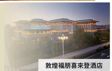
敦煌福朋喜來登酒店