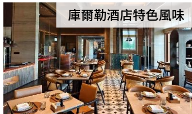
庫爾勒酒店特色風味