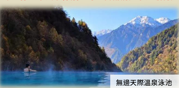
無邊天際溫泉泳池

酒店坐落於阿壩藏族羌族自治州理縣古爾溝鎮。酒店可享受天然溫泉以及周邊自然美景，如畢棚溝、桃坪羌寨和米亞羅國家風景保護區等。古爾溝溫泉是礦物溫泉，能讓住客舒展身心，煥發活力。