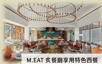
M.EAT 炙餐廳享用特色西餐