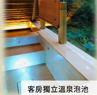
客房獨立溫泉泡池