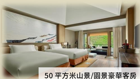
50 平方米山景/園景豪華客房