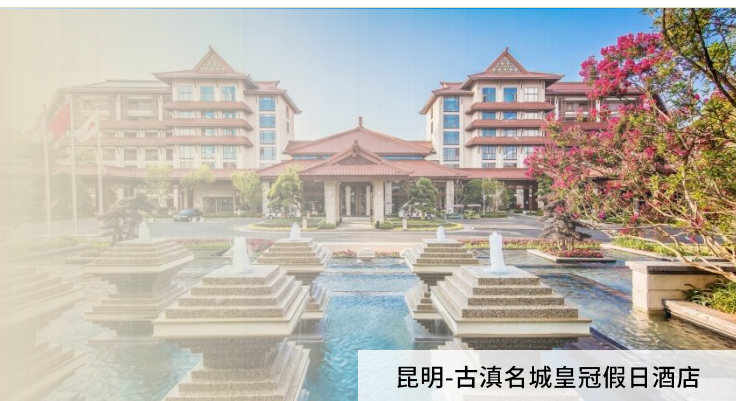
昆明-古滇名城皇冠假日酒店