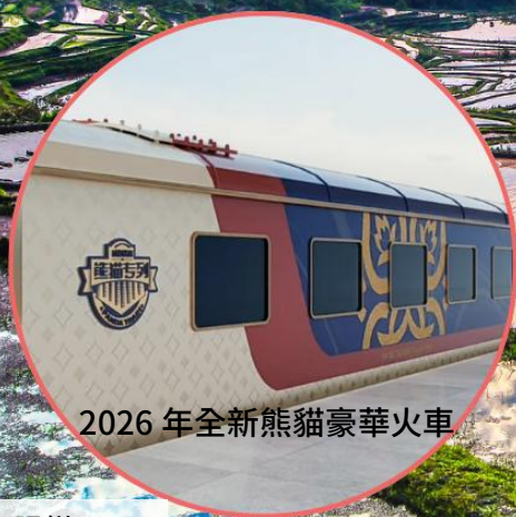
2026 年全新熊貓豪華火車