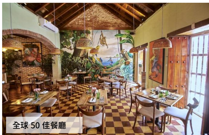
全球 50 佳餐廳

◆ 哥倫比亞：全球 50 佳餐廳、拉丁美洲 50 佳餐廳、著名餐廳 Juan Del Mar、著名餐廳 Carmen