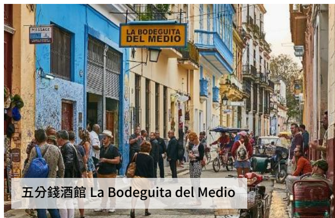
五分錢酒館 La Bodeguita del Medio

◆ 墨西哥：拉丁美洲 50 佳餐廳、著名餐廳 Museo de la Gastronomía、Lorea、Villa Maria