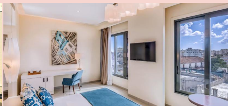
夏灣拿住宿 3 晚五星級 Hotel Meliá Collection Gran Hotel Bristol Habana Vieja 酒店或同級