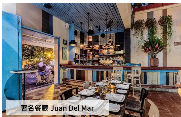
著名餐廳 Juan Del Mar