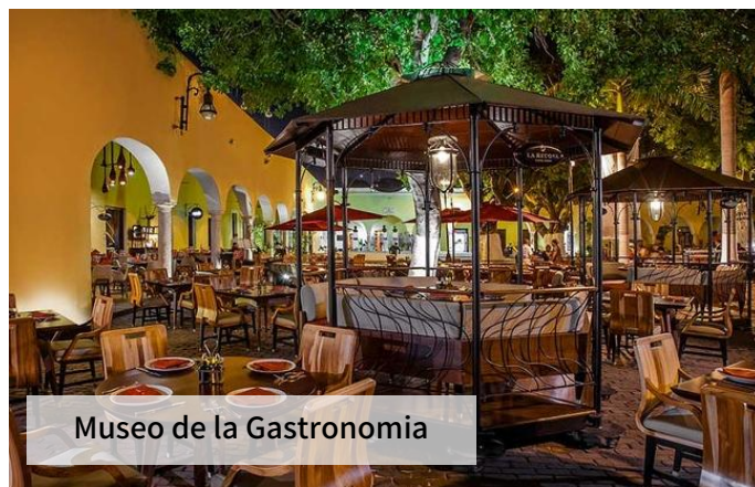
Museo de la Gastronomía

◆ 哥倫比亞：全球 50 佳餐廳、拉丁美洲 50 佳餐廳、著名餐廳 Juan Del Mar、著名餐廳 Carmen