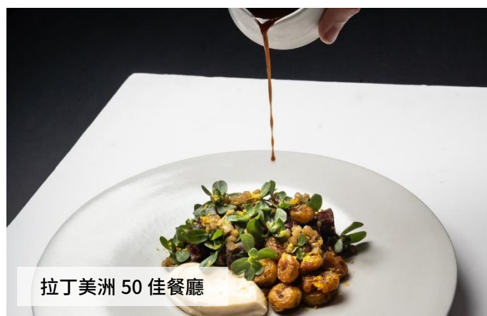
拉丁美洲 50 佳餐廳