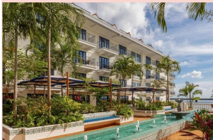
巴拿馬城 - Sofitel Legend Casco Viejo 酒店或同級