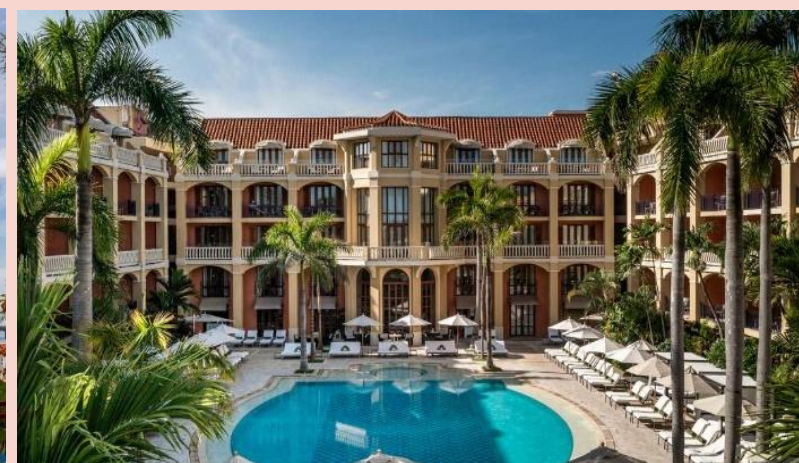
卡塔赫納 5 星級 Sofitel Santa Clara 酒店或同級