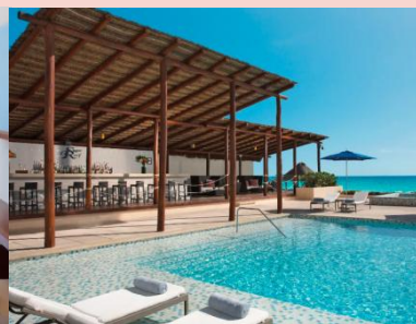
入住 2 晚坎昆五星級 Secrets The Vine Cancun 全包式酒店或同級，盡享醉人加勒比海風情。