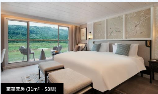
豪華套房 (31m 2 · 58間)