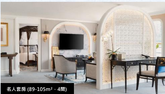
名人套房 (89-105m 2 · 4間)