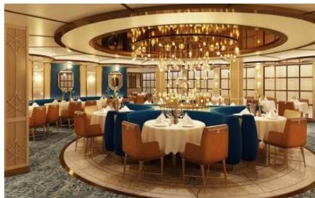
莎芭堤妮義麵餐廳 Sabatini's Italian Trattoria