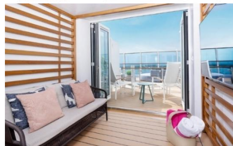
小屋迷你套房面積約 329 平方尺