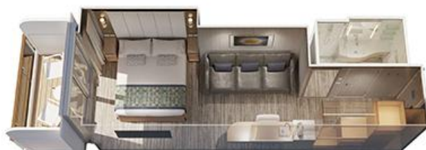
露台房面積約 235 平方尺