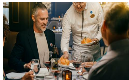
皇冠海鮮牛排餐廳 Crown Grill