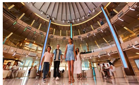
中庭廣場 The Piazza

新一代中庭廣場透過動感景觀和創新體驗，使您與世界相連。漫步在令人讚嘆不已的中庭廣場 - 各式活動的中心，靈感來自歐洲充滿活力的廣場。將全世界帶給您，享受全方位海景。