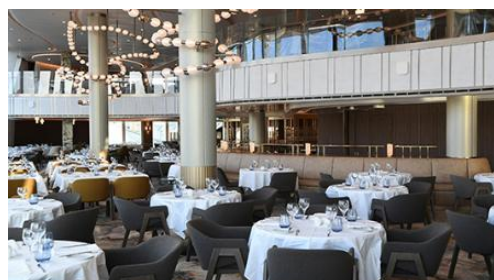
三層樓主餐廳 Three-level Dining Room