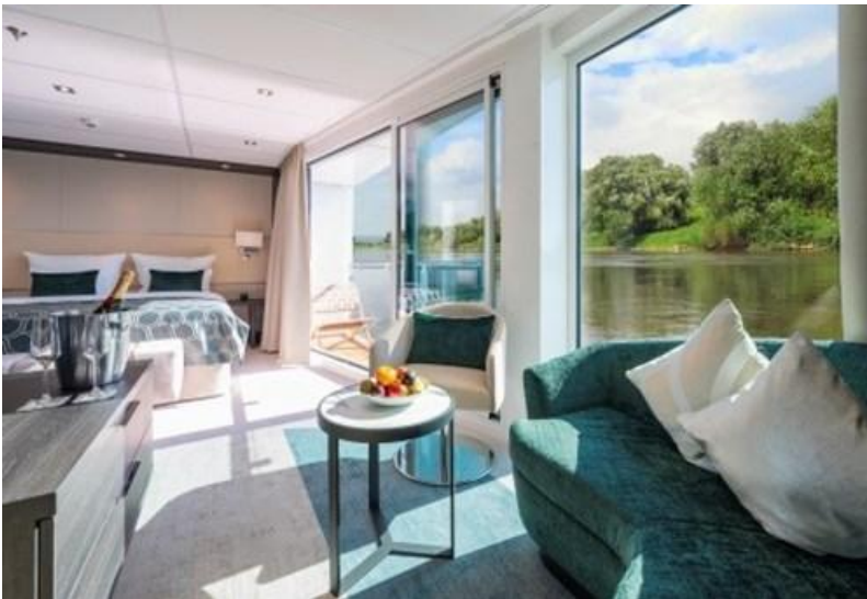
Amadeus Suite - with French balcony 露台套房 - 附法式陽台 房間面積約 236 平方尺 位於第 3 層(Mozart Deck)