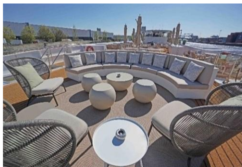
戶外甲板休息區 Sun Deck