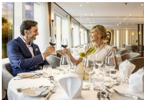
晚餐時段無限添飲優質紅、白葡萄酒