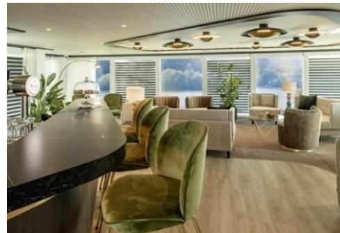
Amadeus Club 24 小時供應咖啡及茶