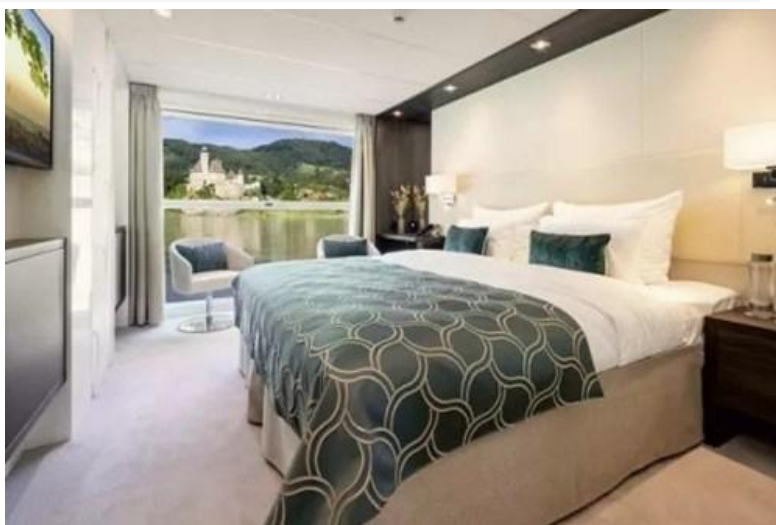
Cat. A1/B1 - with French balcony 河景房 - 附法式陽台 房間面積約 161 平方尺 位於第 3 及 2 層(Mozart & Strauss Deck)