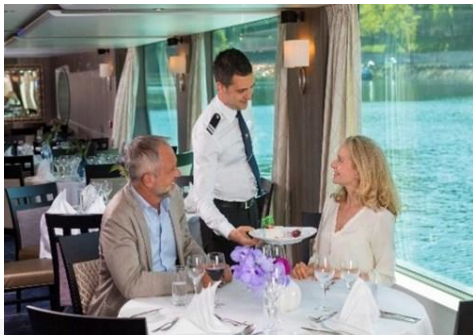
歡迎及歡送雞尾酒會、歡迎晚宴和船長晚宴