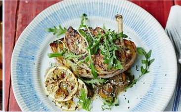
*Jamie's Italian：供應午晚餐，由名廚 Jamie Oliver 主理，打造正宗意式風味