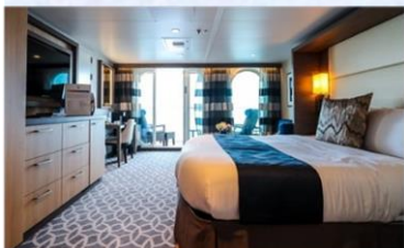
標準套房 (海際套房系列) (J1/J4)：276 平方呎