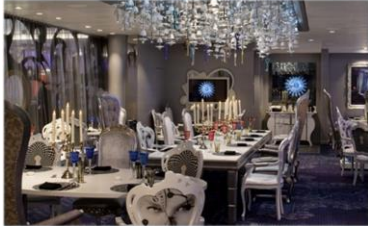
*大董意境坊：供應晚餐，與名店大董合作，體驗中國風的意境菜