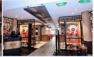
*川谷薈：供應午晚餐，品嚐正宗川菜風味