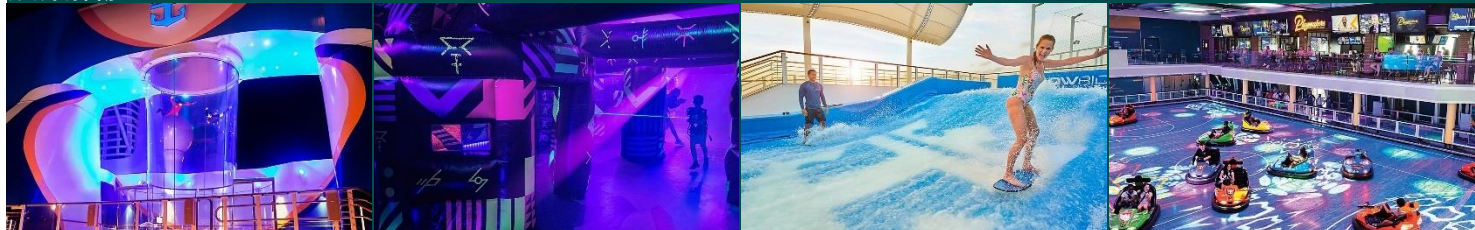
甲板跳傘 Z 星大戰™ 甲板衝浪® 碰碰車