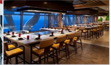
*日式鐵板燒：供應午晚餐，提供新鮮海產及頂級肉類，正宗日式美食應有盡有