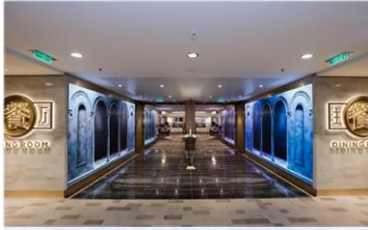
*主餐廳：供應早午晚餐的中西式美食