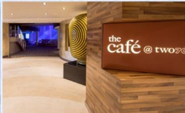
*270 度咖啡廳：供應早午餐，品嚐多款熱三文治、自選沙律及自家製濃湯