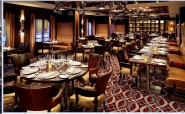
*美式扒房：供應午晚餐，品嚐傳統牛排餐廳的經典美食