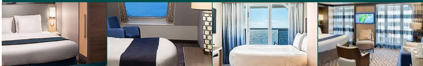
內艙房：約 166 平方呎 海景房：約 182 平方呎 海景露台房：連露台約 253 平方呎 標準套房：連露台約 331 平方呎