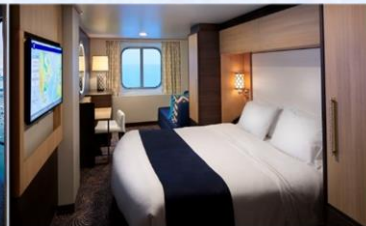
海景房 (1N/2N)：182 平方呎