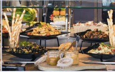
*帆船美食廣場：供應早午晚餐的環球美食自助餐