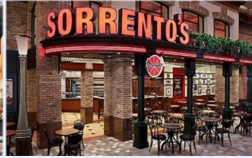
*索倫托餐廳：供應午晚餐的意式 Pizza 美食