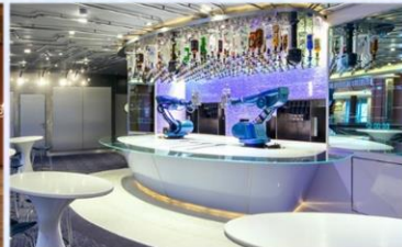
*機器人酒吧：科技感十足的機器人酒吧，輕鬆下達指令，即可調製專屬特飲