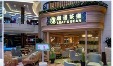
*咖啡茶道：滿足各年齡層賓客，供應中國茶、咖啡等冷熱飲品，以及現烘中西式點心