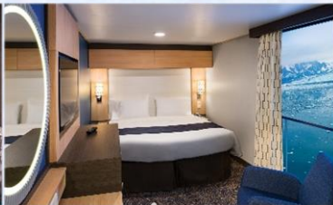
虛擬露台內艙房 (1U/2U)：166 平方呎