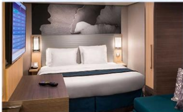
內艙房 (1V/2V/3V/4V)：166 平方呎