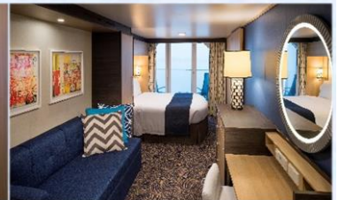
海景露台房 (1D/2D/3D/4D/5D)：198 平方呎