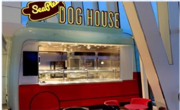
*熱狗屋：品嚐不同風格的熱狗：紐約風格、芝加哥風、格或你的個人風格。