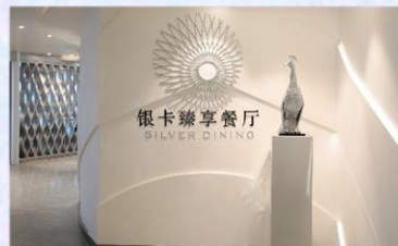
Sea Class 海際套房系列專屬餐廳