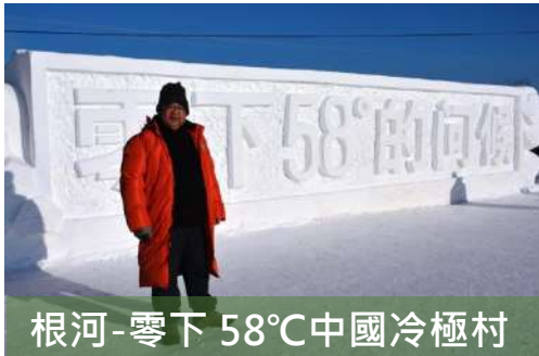
根河-零下 58°C 中國冷極村