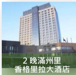
2晚滿州里 香格里拉大酒店