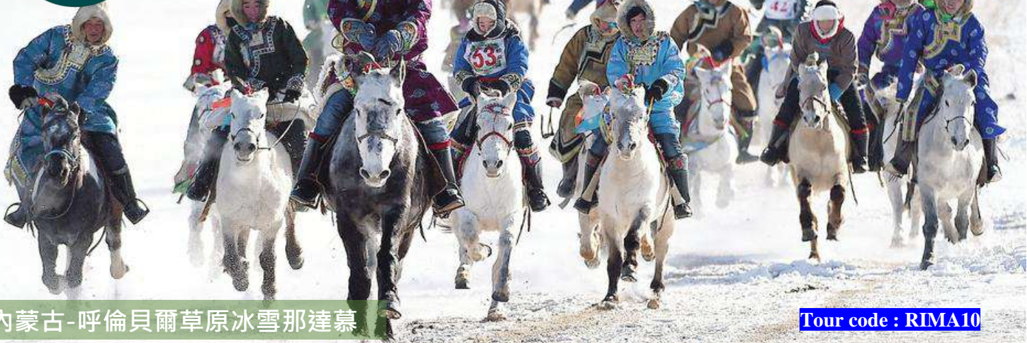
內蒙古-呼倫貝爾草原冰雪那達慕