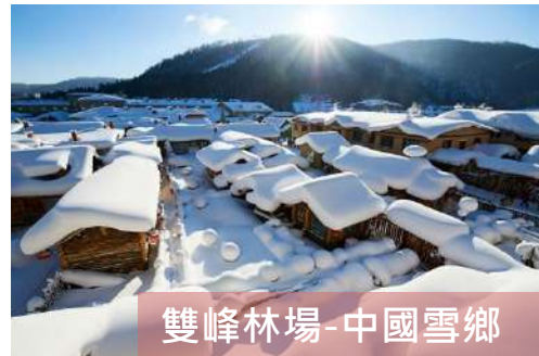
雙峰林場-中國雪鄉