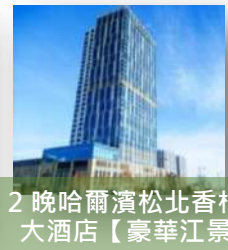
2晚哈爾濱松北香格里拉大酒店【豪華江景房】