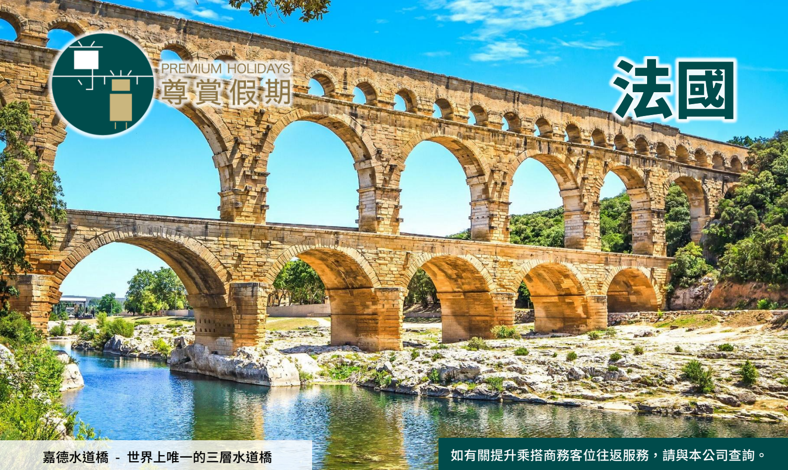
嘉德水道橋 - 世界上唯一的三層水道橋