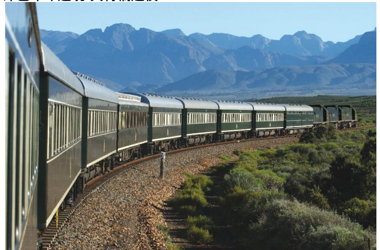
↩：Rovos Rail 非洲之傲列車豪華套房(Deluxe Suite)

非洲之傲列車繼續在津巴布韋往南驅進，沿途經過一些古老的猴麵包樹地帶及續往關達小鎮(Gwanda)。列車晚上抵達津巴布韋邊境-貝特橋過夜。