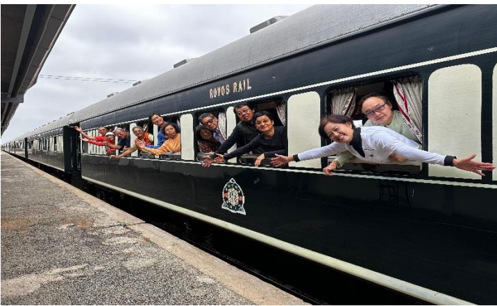
↩：Rovos Rail 非洲之傲列車豪華套房(Deluxe Suite)

馬托博國家公園 ：佔地 424 平方公里，參觀原始人岩洞石刻壁畫，英國開普殖民地總理約翰羅茲陵墓。原始人生活的岩洞最早可追溯到舊石器時代的中期，即大約 28 萬年前。剪影出原始人狩獵聚居的一些根源。