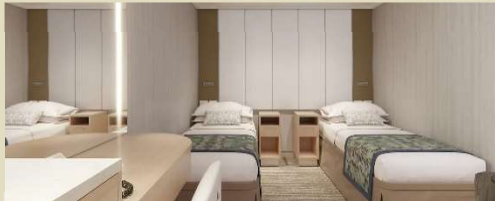
內艙房 Interior 房間面積約 136 至 145 平方尺

太陽公主號高 21 層，設 2,157 間客艙，包括 50 間套房艙和 100 間相連房，露台空間更闊落。除了一般房型外，太陽公主號更推出全新級別的「精選系列」套房艙系列，除了可以享受獨有的尊尚禮遇外，還可於專屬的「精選餐廳」、「精選酒廊」用餐等，詳情可向本公司查詢。