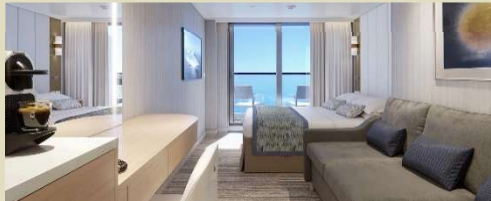
露台房 Deluxe Balcony 房間面積約 235 平方尺