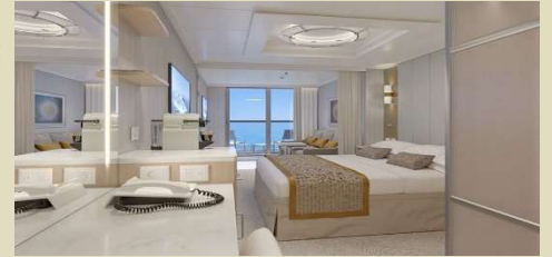
迷你套房 Mini Suite 房間面積約 303 平方尺