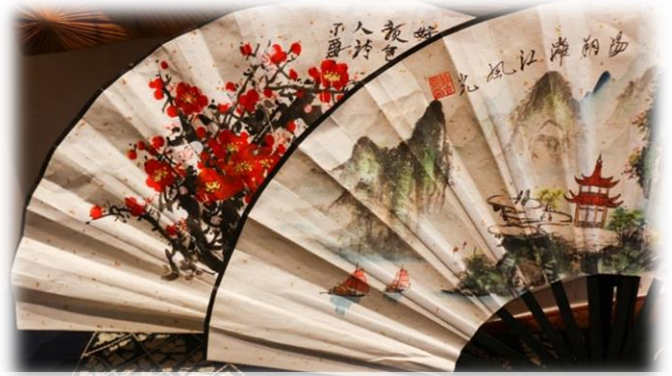
源自“中國畫扇之鄉”福利鎮的百年技藝畫扇課程