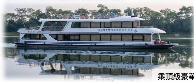
乘頂級豪華遊船漫遊灕江