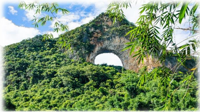
遠觀十里畫廊月亮山

陽朔 “桂林山水甲天下，陽朔山水甲桂林”，高度概括了陽朔自然風光的美，其集中了桂林山水的精華，是中國重要的旅遊城鎮之一，被《米芝蓮旅遊指南》評為最高級別「三星級旅遊推薦」美譽。