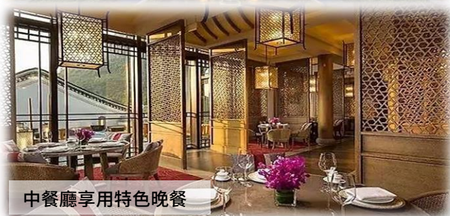
中餐廳享用特色晚餐