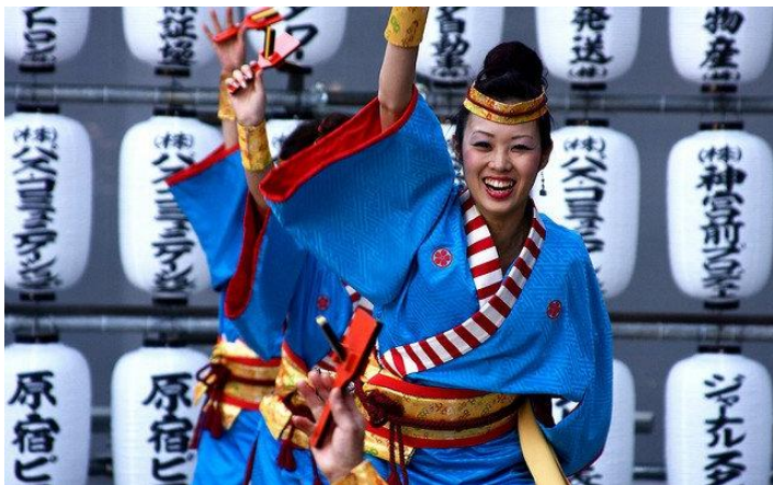
公主郵輪『Diamond Princess』鑽石公主號

高知鳴子舞祭(特別安排預留觀覽席)：日本 10 大祭典之一，被視為高知的夏季象徵，已超過 60 年。來自日本各地的支持者每年都會在此聚集，是一場充滿活力、威力十足的祭典。舞者們手裡拿著被稱為「鳴子」(可敲出節奏的樂器)，盡情舞動全身。特別安排預留指定觀覽席，感受尊貴震撼體驗！