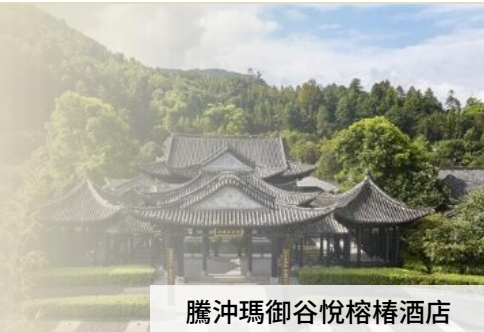
騰沖瑪御谷悅椿酒店