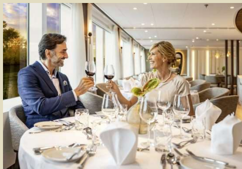
晚餐時段無限添飲優質紅、白葡萄酒