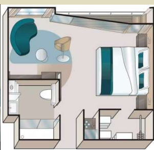
Cat. Suite - Walk out Balcony 露台套房- 落地全景窗戶及露台 位於第 3 層(Mozart Deck)，房間面積約 284 平方尺