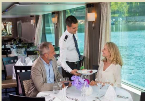
歡迎及歡送雞尾酒會、歡迎晚宴和船長晚宴