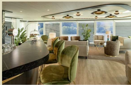
Amadeus Club 24 小時供應咖啡及茶