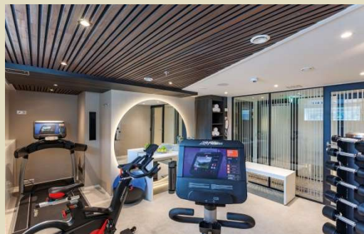
24 小時健身中心及免費單車借用服務