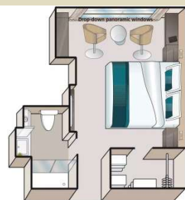
Cat. A1/B1 - Drop Down Panoramic Window 河景房 - 落地全景窗戶 位於第 3 及 2 層(Mozart & Strauss Deck)，房間面積約 188 平方尺