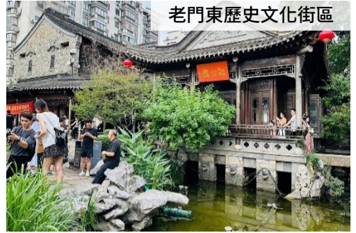
老門東歷史文化街區