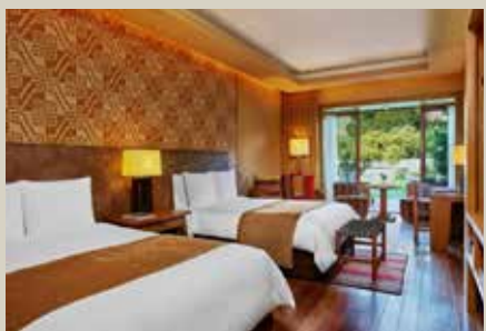
烏魯班巴河谷入住5星級Tambo Del Inka Resort & Spa渡假村，烏魯班巴唯一擁有火車站前往馬丘比丘