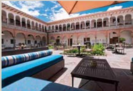
利馬及庫斯科入住5星級JW Marriott 酒店或同級