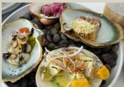
海中玫瑰La Rosa Nautica 海景餐廳