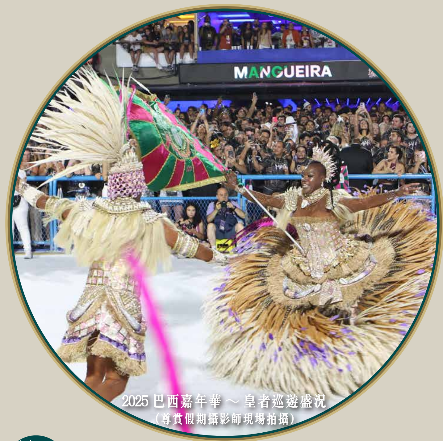
2025 巴西嘉年華～皇者巡遊盛況