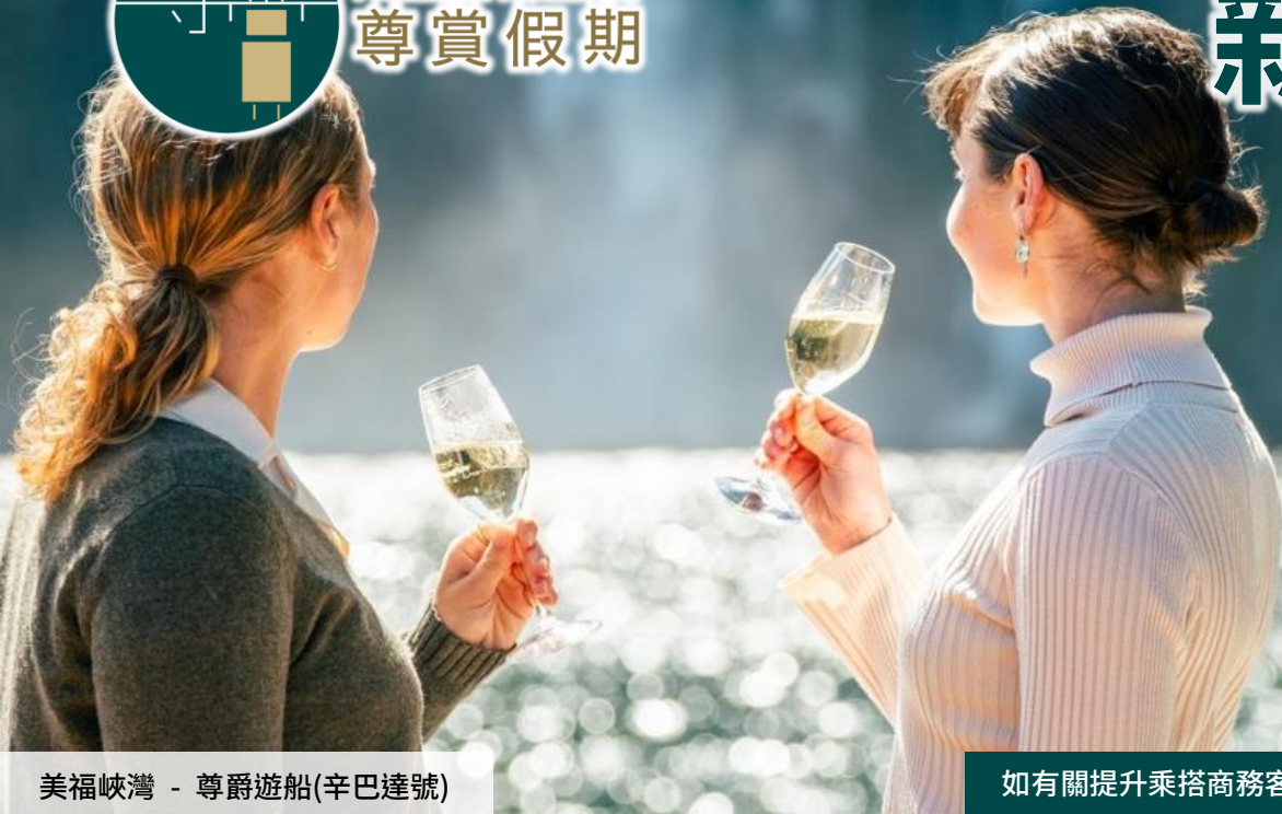
美福峽灣 - 尊爵遊船(辛巴達號)