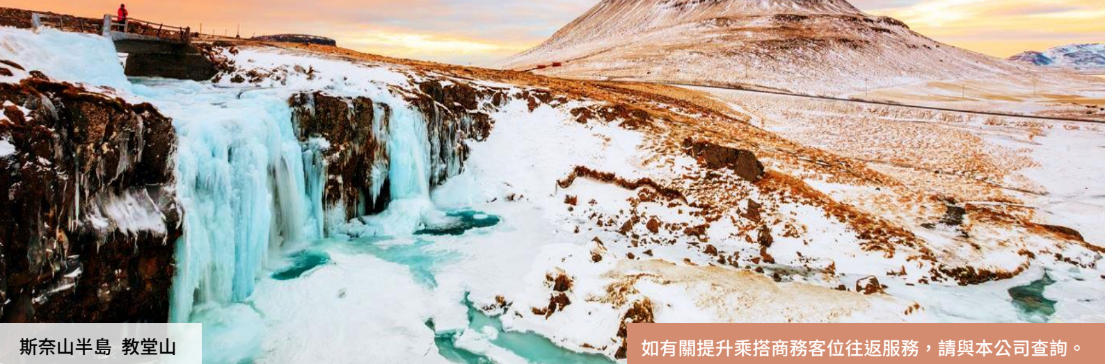
斯奈山半島 教堂山