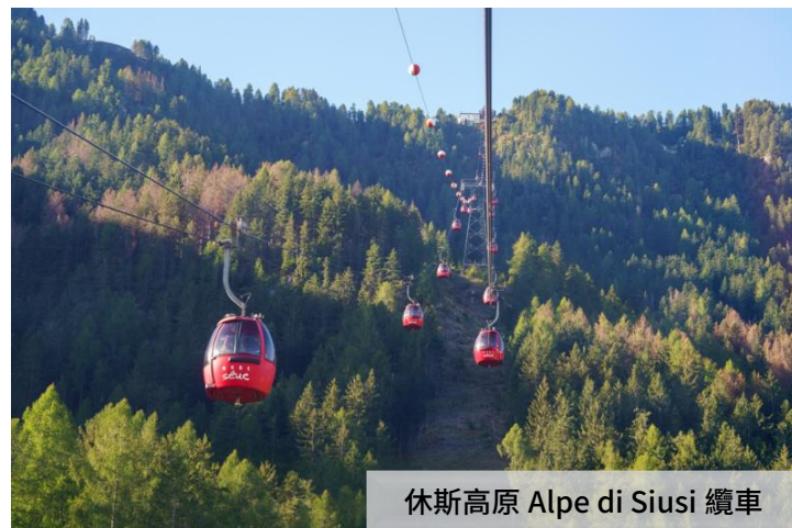
休斯高原 Alpe di Siusi 纜車