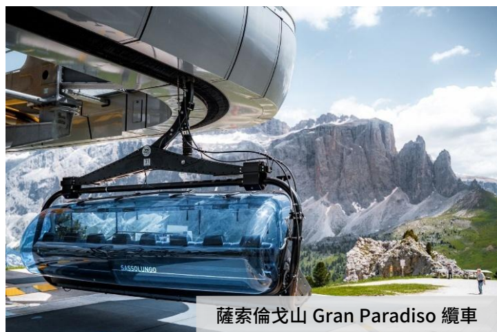
薩索倫戈山 Gran Paradiso 纜車