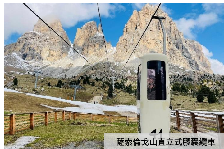
薩索倫戈山直立式膠囊纜車