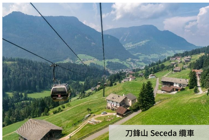
刀鋒山 Seceda 纜車