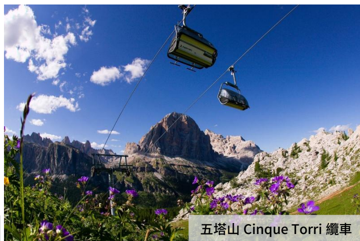
五塔山 Cinque Torri 纜車