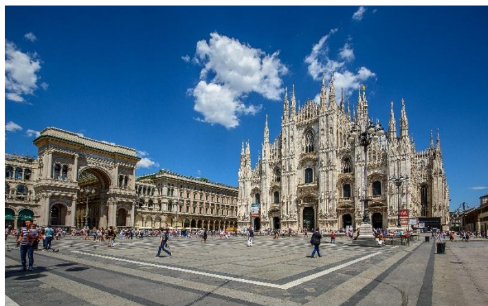
📍 馬努爾拱廊：長廊及購物大道名店林立，可以盡情購物。