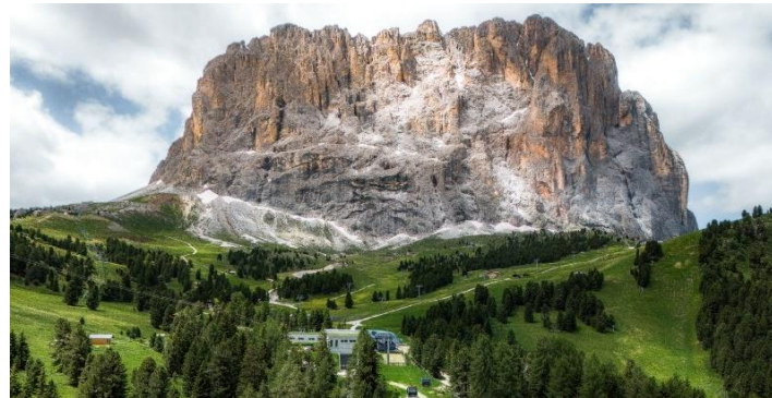
🏔️Gran Paradiso 纜車：8 人座藍色橫式多座位有蓋吊椅，一路上眼望薩索倫戈山及山下壯闊景色。