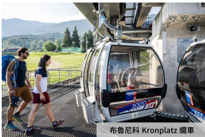
布魯尼科 Kronplatz 纜車

精心安排搭乘多洛米蒂山區多款特色纜車，穿梭於翠綠谷地與嶙峋山脊間，在空中變換視角，全方位觀賞令人屏息的壯闊仙景。