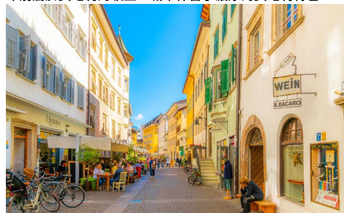
📍波札諾市區漫步：主教座堂、沃爾特廣場、中世紀建築小巷 🏠：Parkhotel Laurin 或 Four Points by Sheraton 酒店或同級