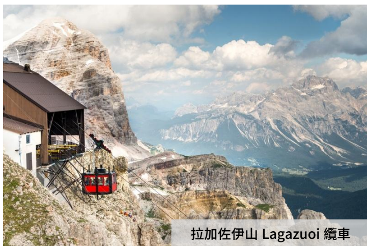
拉加佐伊山 Lagazuoi 纜車