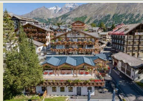
Walliserhof Grand-Hotel & Spa