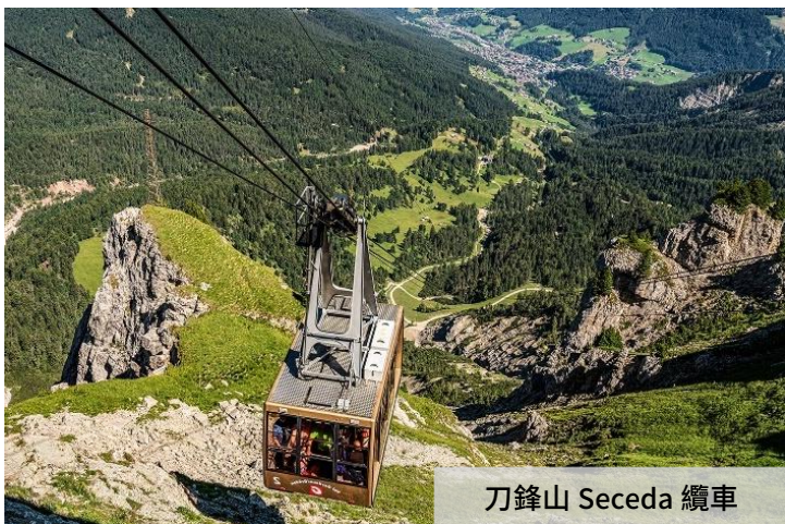
刀鋒山 Seceda 纜車