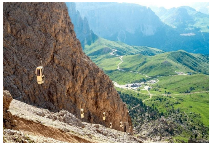
📍賽拉隘口：海拔 2,244 米，多洛米蒂山脈的一處高山隘口，可飽覽周圍群峰的壯麗景色，包括塞拉山和薩索倫戈山。