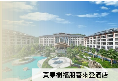
黃果樹福朋喜來登酒店