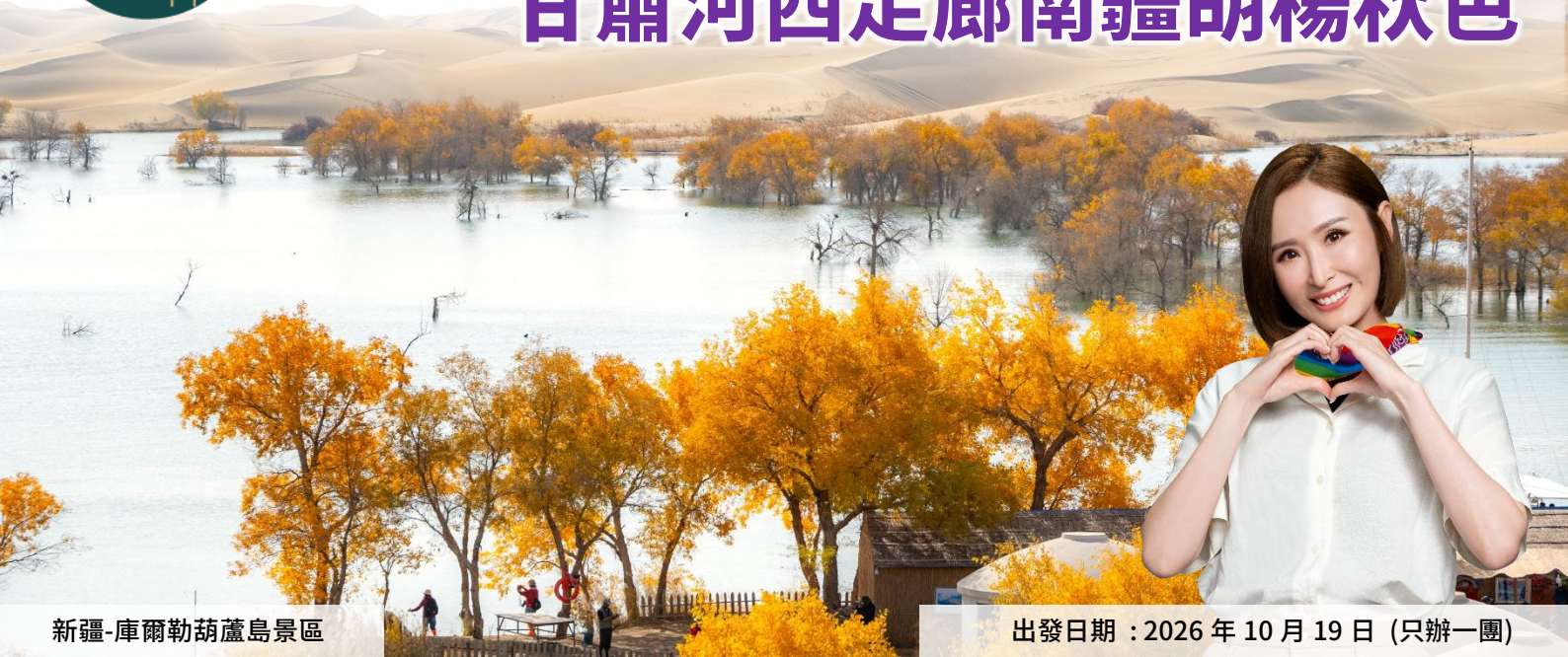
新疆-庫爾勒胡蘆島景區